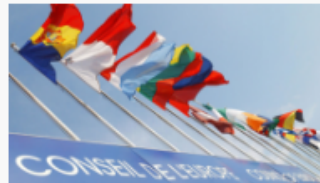
Specific projects in Member states