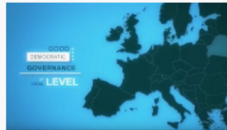
12 Principles of Good Governance and ELoGE