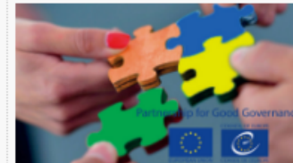
Partnership for Good Governance